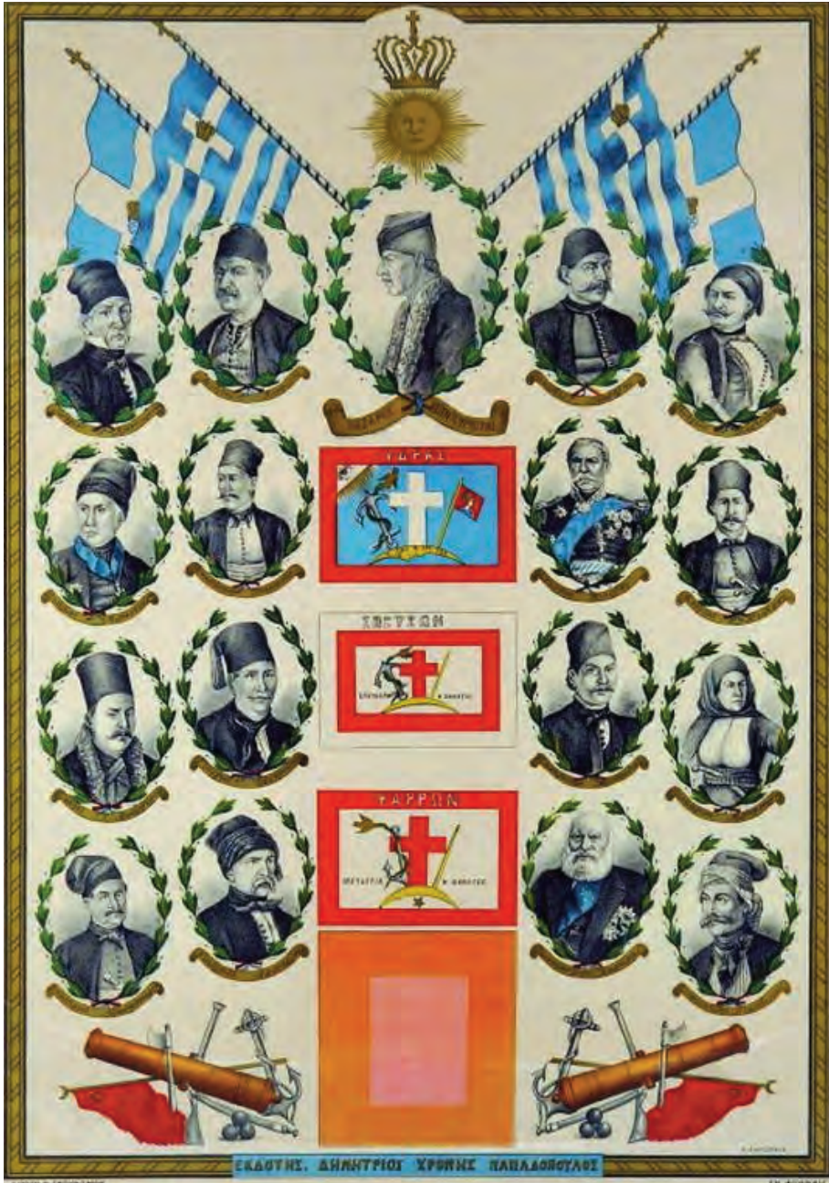
Πηγή: Οδός Ελλήνων, Το πάνθεον των ηρώων του ναυτικού αγώνα του 1821